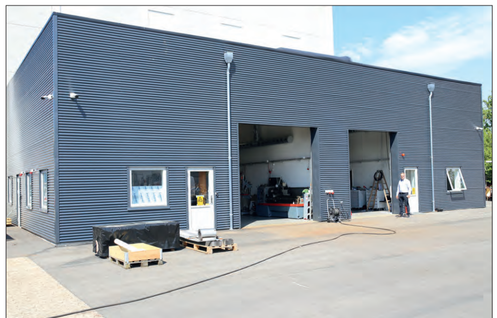
Laboratoriet giver danske leverandører mulighed for at opnå adgang til nye markeder, fremhæver FORCE Technology.

Tlf. +45 98 92 21 22 - salg@expo-net.dk - www.expo-net.dk