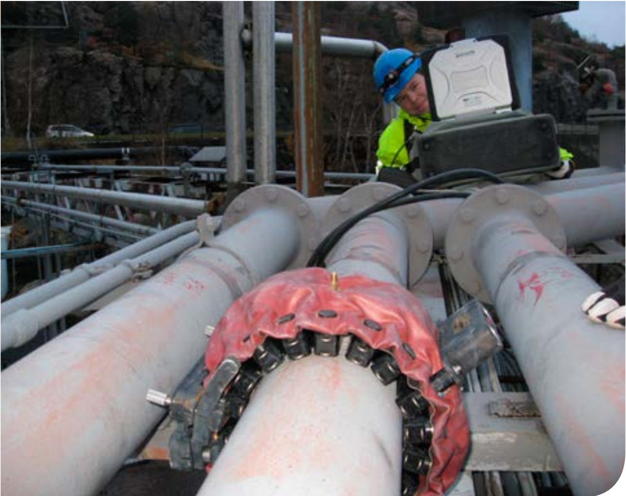
Long Range Guided Wave bälte med 24 st ultraljudssensorer

FORCE Technology erbjuder snabb statusbedömning av rörledningar med ultraljud.